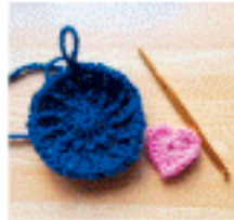
創作活動は人気のレク になっています。