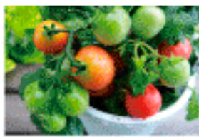
お庭やベランダで家庭菜園を 行います!!