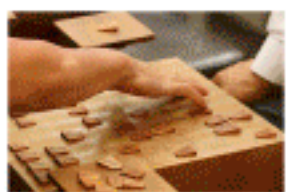
将棋なども楽しめます。 定期的なお出かけも人気です。